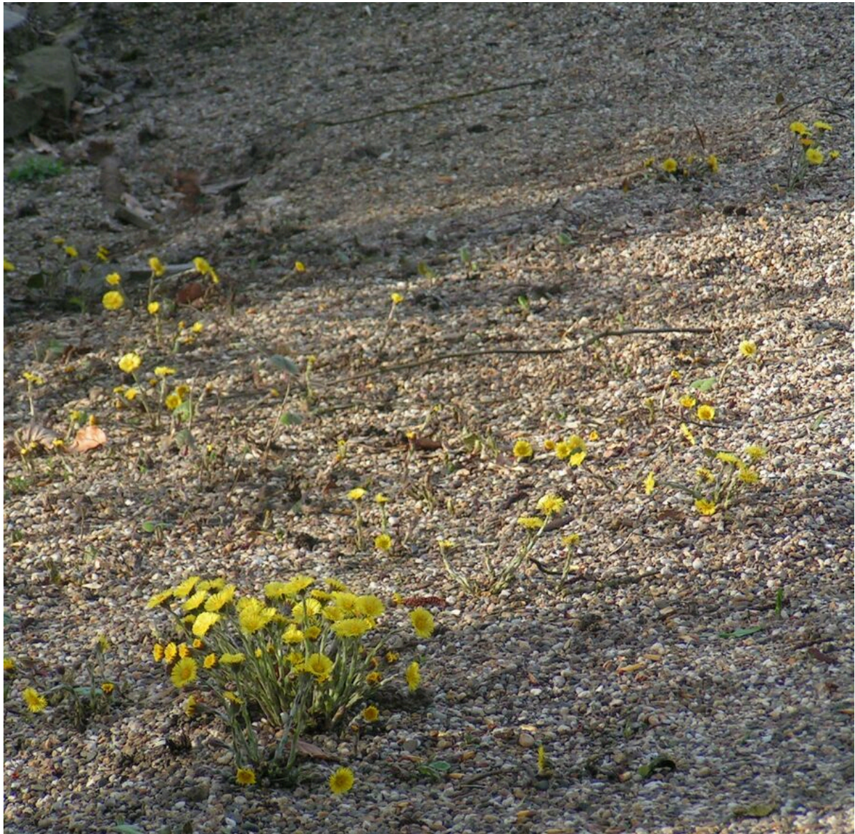
Hufplattich, Blüten Anfang März

Jetzt zur Heilpflanze: Seit je her wird die schleimlösende Wirkung bei allen Arten von Husten, Asthma, Bronchitis etc. schon in ihrem lateinischen Namen beschrieben. Zusätzlich wird von Unterstützung bei Magen-Darm-Problemen, Behandlung von Schürfwunden, Entzündungshemmung und mehr berichtet. Verschiedene Darreichungen wie Tees oder Sirup sind dokumentiert. Vor 30 Jahren war der Hufplattich Heilpflanze des Jahres. Inzwischen wird wegen der Gefahr von Leberschäden und Krebsgefahr von Anwendungen abgeraten. Also siehe Vorspann: Sprechen Sie mit Ihrem Arzt oder Apotheker.